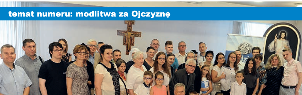
temat numeru: modlitwa za Ojczyznę