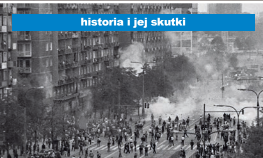
historia i jej skutki

Czy kryzys wiary dotarł już do Polski? Czy doświadczamy go także w Kościele katolickim? Dlaczego Europa odrzuca chrześcijańskie korzenie?