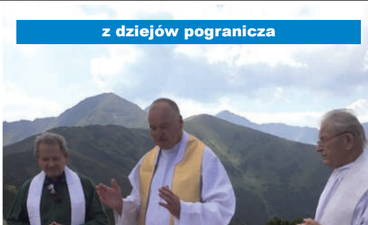
z dziejów pogranicza

Wprowadzenie stanu wojennego nie tylko przerwało pozorowany dialog władzy ze społeczeństwem oraz legalny okres działalności Solidarności, ale było także brutalną próbą powstrzymania rewolucji moralnej, która rozpoczęła się w Polsce w drugiej połowie lat 70. XX wieku