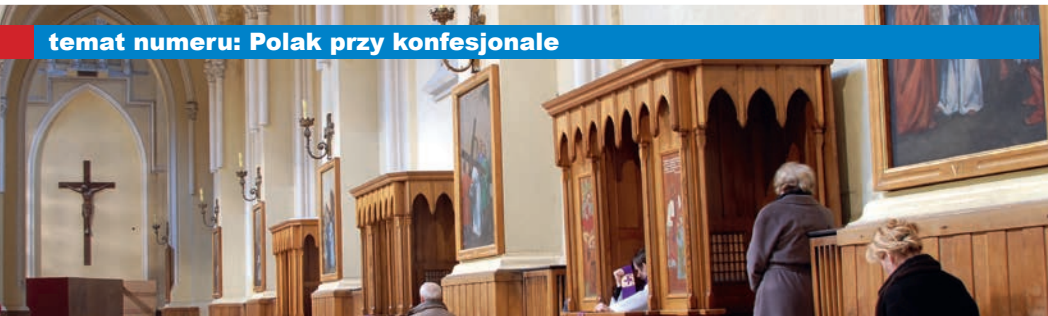
temat numeru: Polak przy konfesjonale