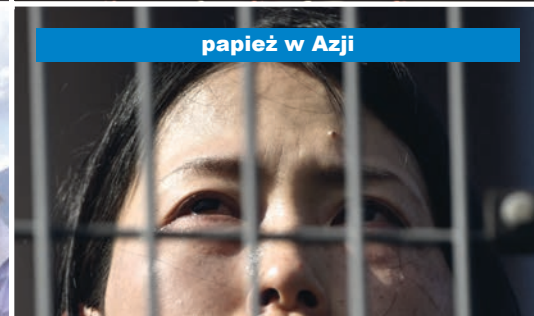
papież w Azji